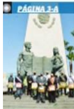
EN ANIVERSARIO DE SU NATALICIO

Se integraron los mil trabajadores a Sindicato CTM