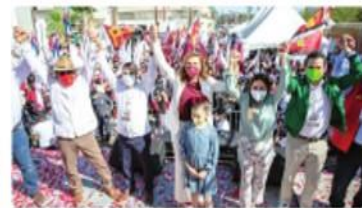
MEXICALI.- Gran convocatoria de estudiantes y abogados en el registro oficial de Marina del Pilar Avila, como candidata a gobernadora.