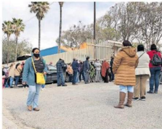
Se estima en Tijuana un aproximado de 150 mil personas de 60 años o más

PARA LA INMUNIZACIÓN del total de adultos mayores en Tijuana, la SSA tiene como meta la aplicación diaria de 20 a 25 mil dosis